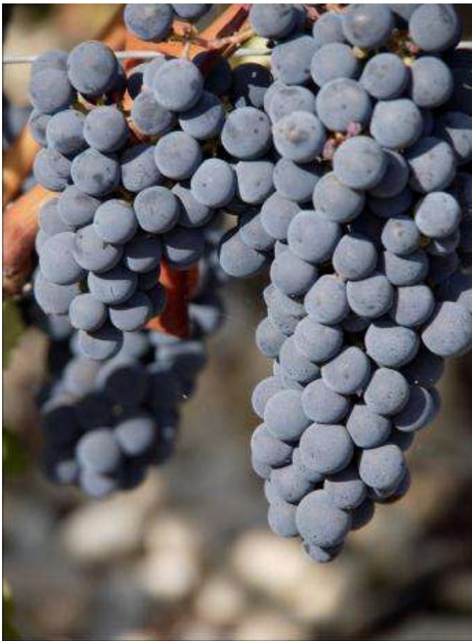
在 Chateau Latour 成長中的 Cabernet Sauvignon

相信大家已經度過了十分愉快的中秋節及國慶長假期。雖然是深秋,但香港還是十分熱。在 Bordeaux 的秋天就不同了。在中午和暖的陽光下氣溫有大約 22°C,到了晚上已經十分涼快,大約只有 12°C。左岸的 cabernet sauvignon 葡萄就靠著泥土上的 gravel 散發出的微溫繼續慢慢成長。右岸的 merlot 早就已經在發酵桶內成為了 vintage 2010 的主角。